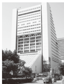
会場の中野サンプラザ