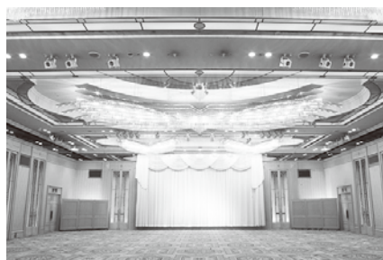
式典会場の13階コスモ